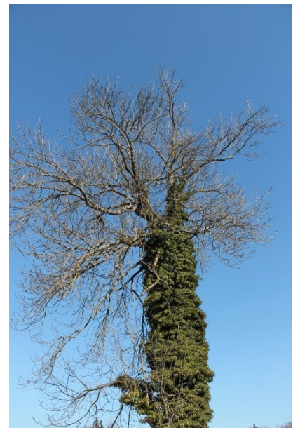
3. Platz, Esther Ruf