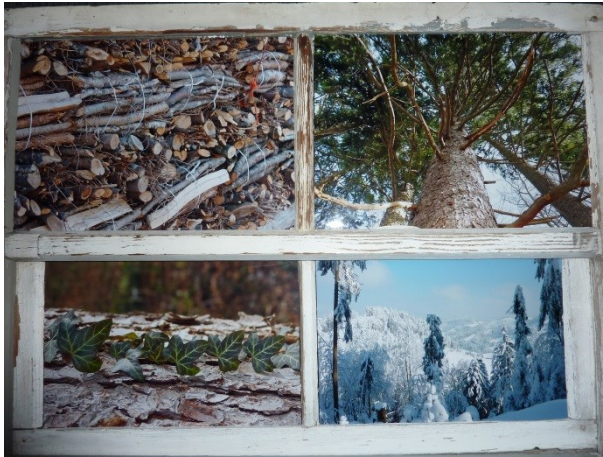
1. Platz, Werner Enderle