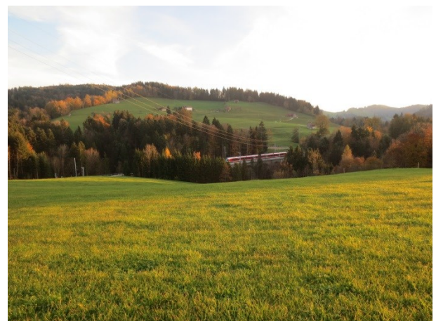
5. Platz, Luis Heidrich