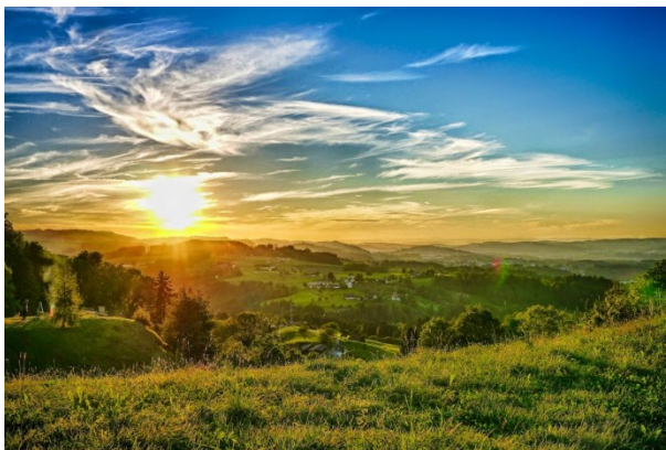
4. Platz, Heinz Beutler